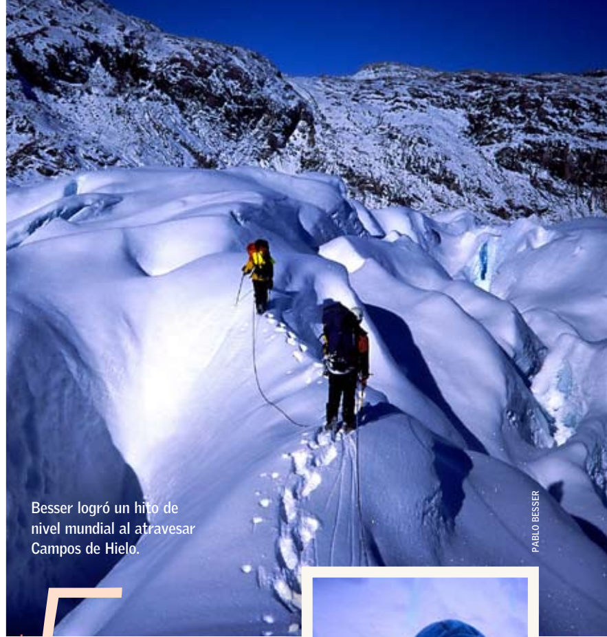
Besser logró un hito de nivel mundial al atravesar Campos de Hielo.