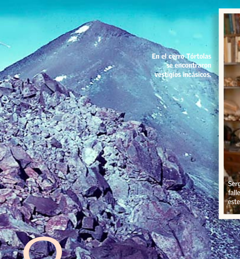
En el cerro Tórtolas se encontraron vestigios incásicos.